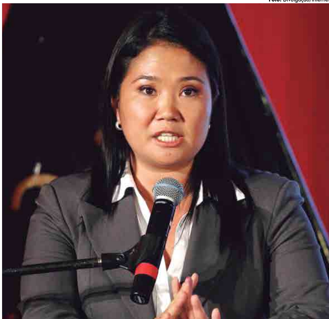
Pesa contra Keiko e outras 19 pessoas supostos pagamentos da construtora Odebrecht à sua campanha eleitoral

Quanto mais a gente viaja, mais a gente descobre o Brasil.