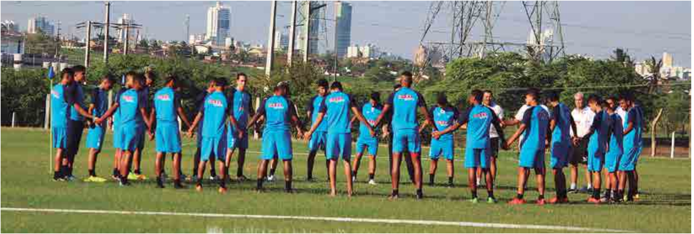
A equipe do Perilima vem sendo a grande sensação do Campeonato Paraibano da segunda divisão. O time venceu todos os jogos que disputou de goleada, sem levar um único gol, mostrando grande superioridade sobre os adversários