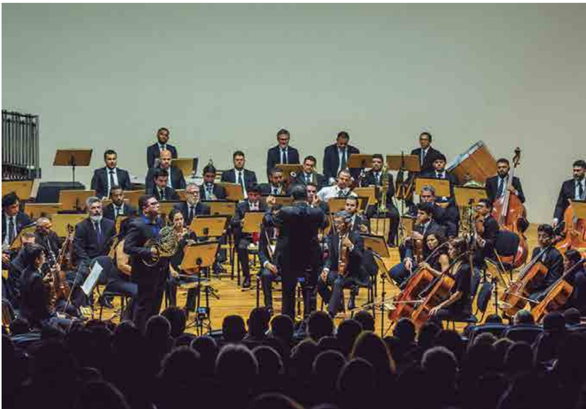
Concerto será iniciado com a "Marcha Escocesa sobre um Tema Popular", do francês Claude Debussy, e encerrado com "Sinfonia nº 5 em Dó menor, Op. 67", do alemão Ludwig van Beethoven