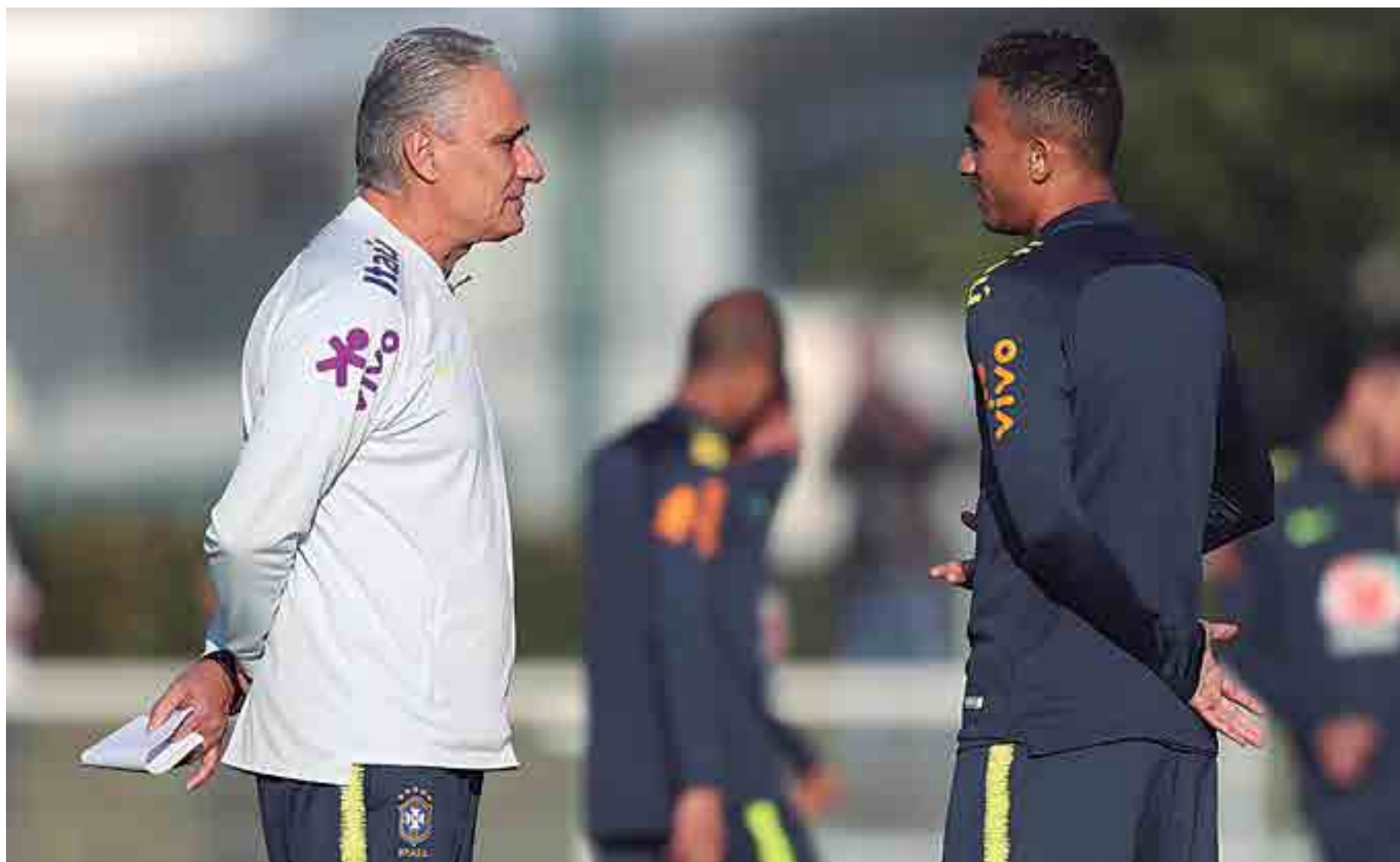
Tite bate um papo com o lateral Danilo durante treinamento da seleção brasileira na Inglaterra. Amanhã, a seleção vai jogar amistosamente contra a Arábia Saudita. Dia 17 contra a Argentina

Naquele início arrebatador de Tite, com vitórias e um futebol de encher os