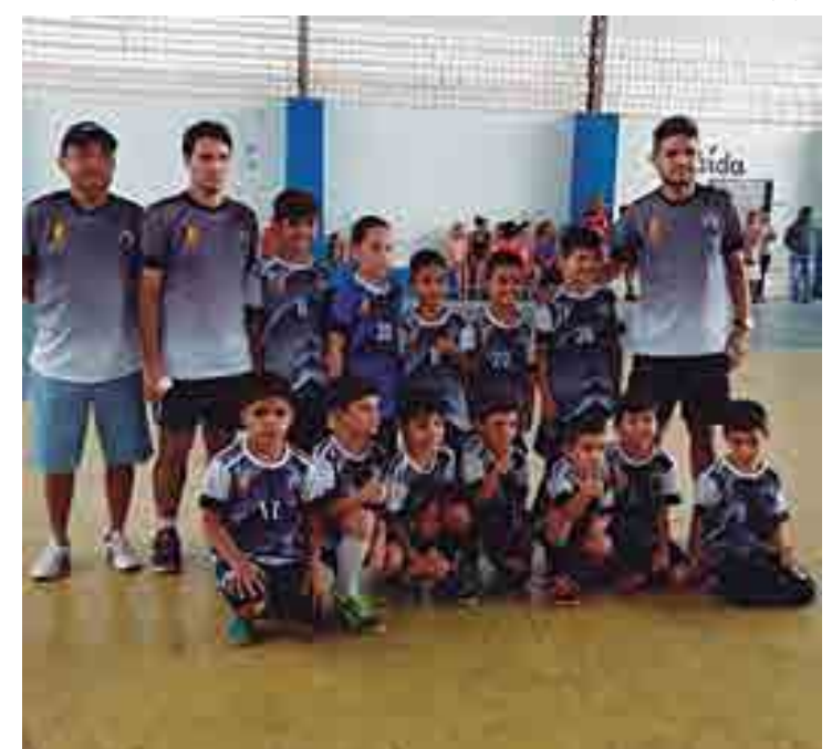
Projeto Menino de Ouro de Guarabira é um dos participantes da Taça JP

Na edição 2018 da Taça Cidade João Pessoa de Futsal, 45 times estarão em ação, distribuídos nas categorias sub-6, sub-7, sub-8, sub-9, sub-10, sub-11 e sub-12. Os jogos finais acontecerão domingo de manhã, na Arena da Apcef-PB, no Altiplano Cabo