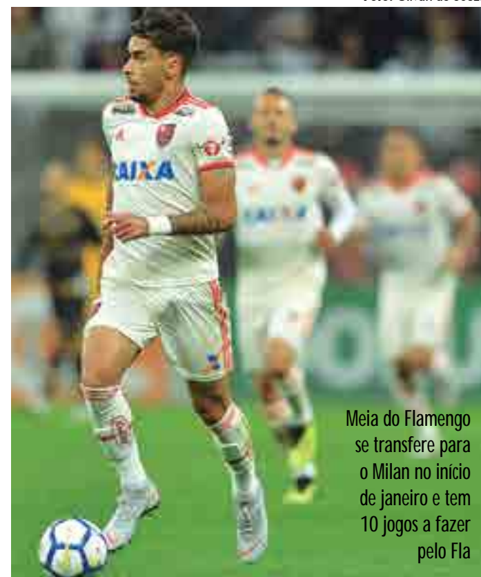
Meia do Flamengo se transfere para o Milan no início de janeiro e tem 10 jogos a fazer pelo Fla

O Instituto Nacional de Câncer (INCA) participa do Outubro Rosa desde 2010, com eventos técnicos, debates e apresentações sobre o tema, além de produzir materiais e recursos educativos para disseminar informações sobre prevenção e detecção precoce da doença.